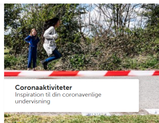
Coronaaktiviteter Inspiration til din coronavenlige undervisning