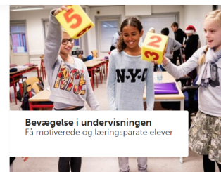
Bevægelse i undervisningen Få motiverede og læringsparate elever