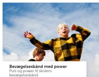
Bevægelsesbånd med power Puls og power til skolens bevægelsesbånd