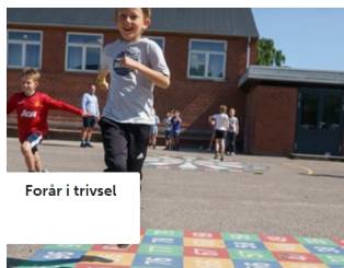
Forår i trivsel

Dansk Skoleidræt har arbejdet på højtryk under nedlukningen og udviklet utallige tilbud og inspiration til bevægelse hele skoledagen bl.a. corona aktiviteter og bevægelse i undervisningen.