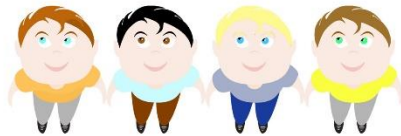
På en lige linje