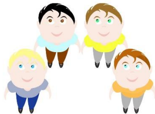
I en trekantsform