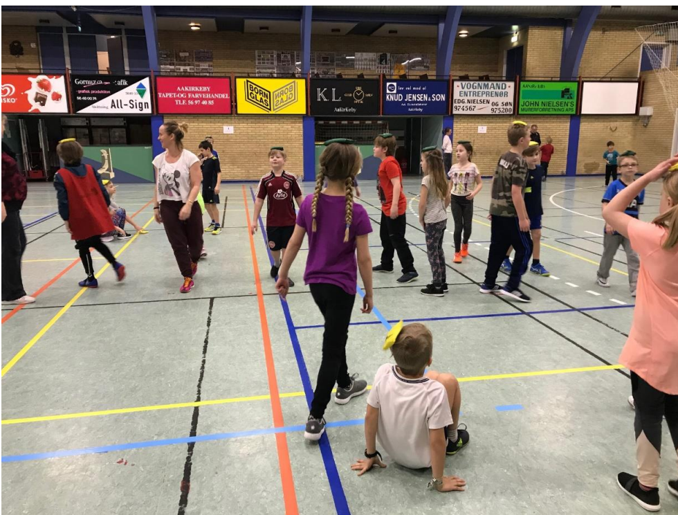
Ærtepose tagfat: Hold ærteposen på hovedet