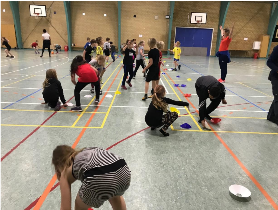
Vulkaner og Isvæfler: Hvem er hurtigst til at vende?