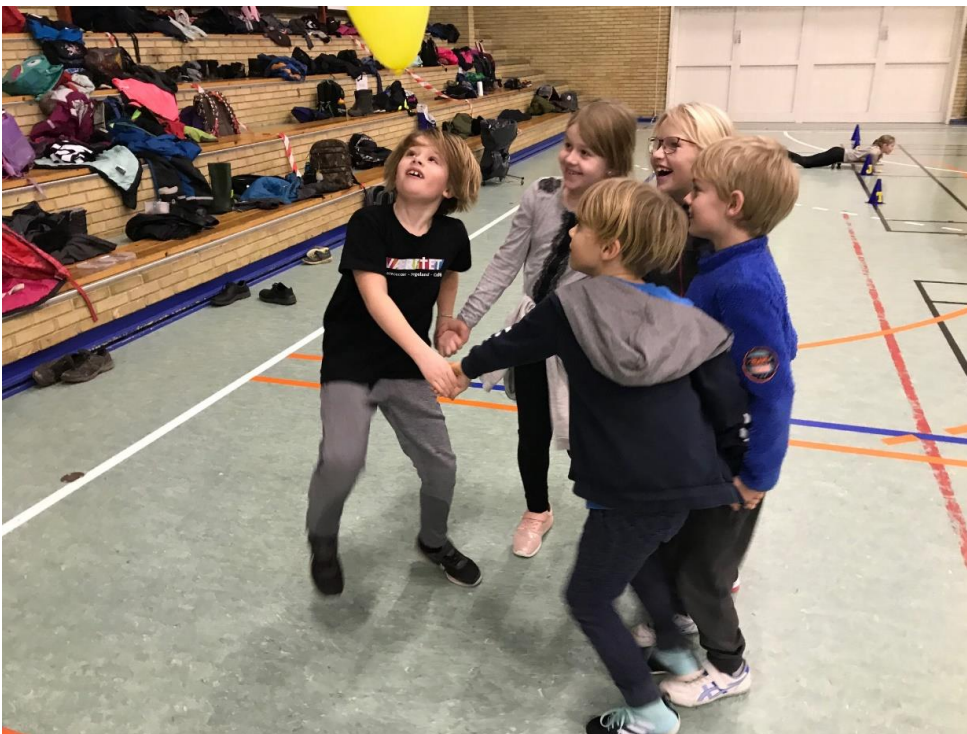
Ballonleg – samarbejde om at holde bolden i luften