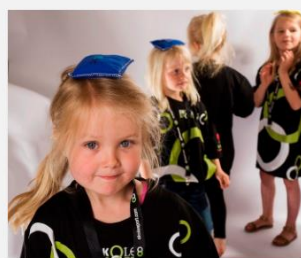
Bevægelse i UUV og SFO