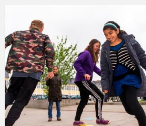
Den Åbne Skole