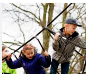
Bevægelse i de boglige fag