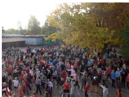
Opvarmning til Skolernes Motionsdag

Hvert år udvikler Dansk Skoleidræt nyt materiale til Skolernes Motionsdag, som alle skoler kan modtage gratis. I år var temaet Fitness.